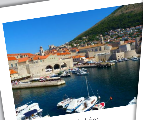
Die Perle der Adria: Willkommen in Dubrovnik!

FREUEN SIE SICH AUF NOCH MEHR VIELFALT, SERVICE & KOMFORT IN ALLEN BEREICHEN AN BORD EINES DER AIDA SELECTION SCHIFFE