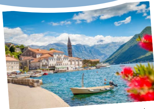
Kotor - die fast 30 km lange, gewundene Bucht erinnert an norwegische Fjorde, gepaart mit mediterranem Klima.